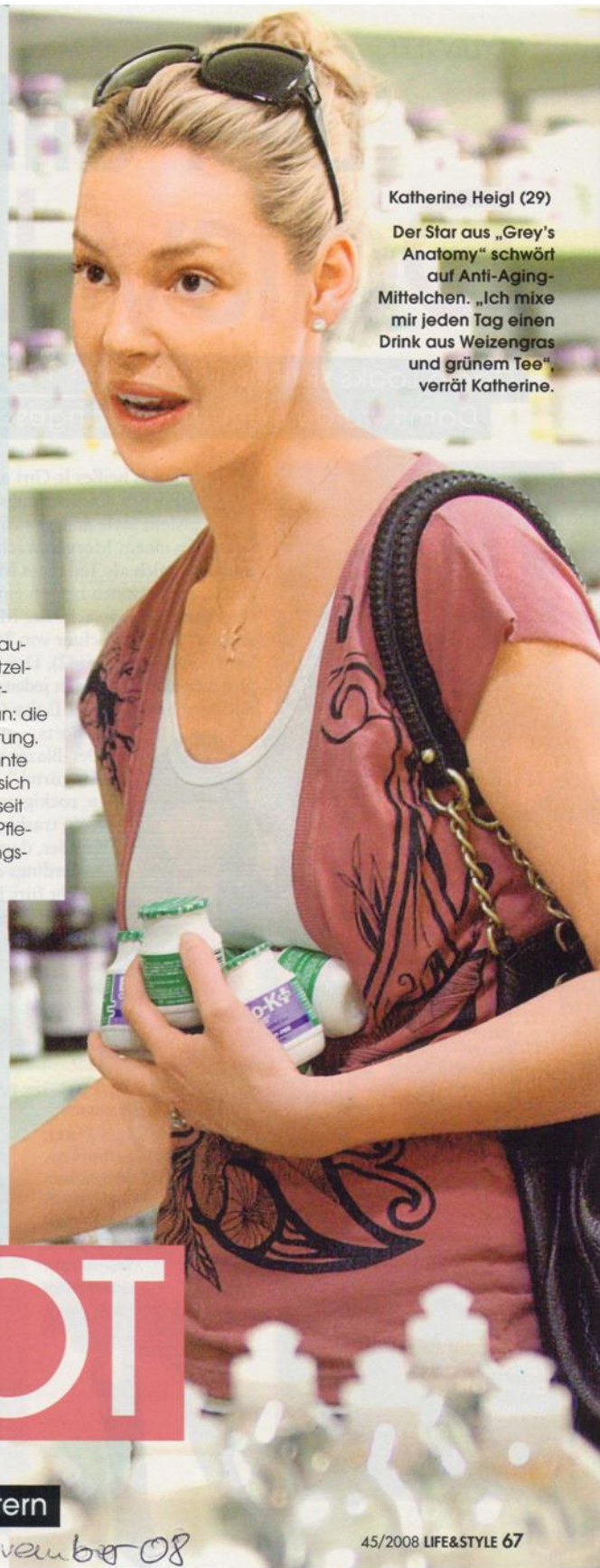
Katherine Heigl (29)

◀ Reinigung „Facial Mask“ wirkt beruhigend mit Matcha Tee und unterstützt mit Goji-Beeren den Zellschutz, um 50 Euro ( www.kultkosmetik.de ).